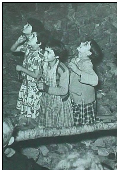
De zieneresjes in het cuadro.

Is deze plaats een toevallige ontmoeting geworden tussen de aartsengel en de zieneresjes of is het door de hemel een bewust gekozen plaats? In de godsdienstgeschiedenis en in het bijzonder van Verschijningen van Maria heeft de hemel om diverse voor ons (nog) verborgen redenen plaatsen gekozen voor ontmoetingen met de