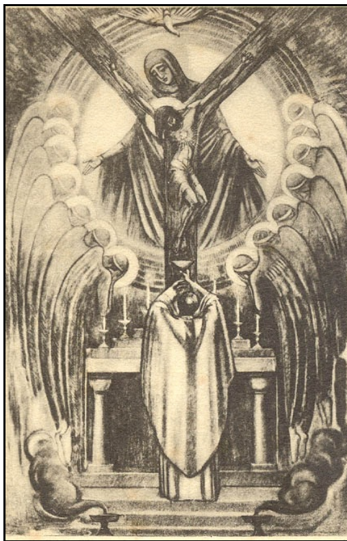
Het onbloedig Kruisoffer van Golgotha

Telkens wanneer de kerk de eucharistie viert, herinnert zij zich deze belofte en keert zij haar blik naar "Hem die komt" (Apok. 1,4). In haar gebed vraagt zij om zijn komst: "Maranatha" (1 Kor. 16,22), "Kom, Heer Jezus" (Apok. 22,20), "moge de genade komen en deze wereld voorbijgaan"! De kerk weet dat de Heer nu reeds tot ons komt in de eucharistie en dat Hij daar is, midden onder ons. Deze aanwezigheid is echter versluierd. Daarom vierten wij de eucharistie "hoopvol wachtend op de komst van Jezus, Messias" en bidden wij: "Ook wijzelf hopen daar [in uw rijk] eens te mogen zijn, om