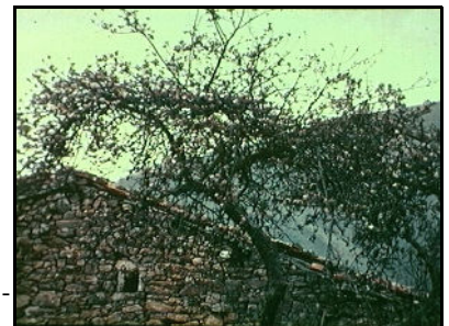
Symbool van de erfzonde

Hier verscheen de aartsengel Michaël op 18 Juni 1961. Deze engel