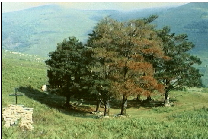
O.L. Vrouw: "Deze plaats is heilig!"

De plaats waar de pijnbomen staan is voor vele pelgrims een ontmoetingsplaats geworden met de levende God. Een bovennatuurlijke Stilte omgeeft de pijnbomen