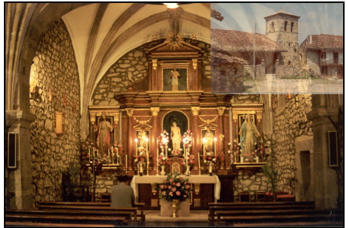
Het kerkje van Garabandal

Na deze eerste schokkende en overrompelde ontmoeting met St. Michaël op zondagavond 18 Juni 1961, holden de zienersjes gedreven door hun godsdienstig instinct naar het dorpskerkje van Garabandal. Toen zij bij de kerkdeur kwamen, durfden zij niet naar binnen en zij gingen achter de kerk om en begonnen daar te wenen Daar waren nog meisjes aan het spelen. Zij vroegen hen