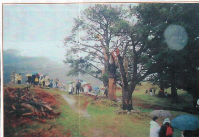
Zoals ik schreef, regende het fel.....

Ik heb haar geantwoord: “Wij zijn niet allen bijeen onder uw