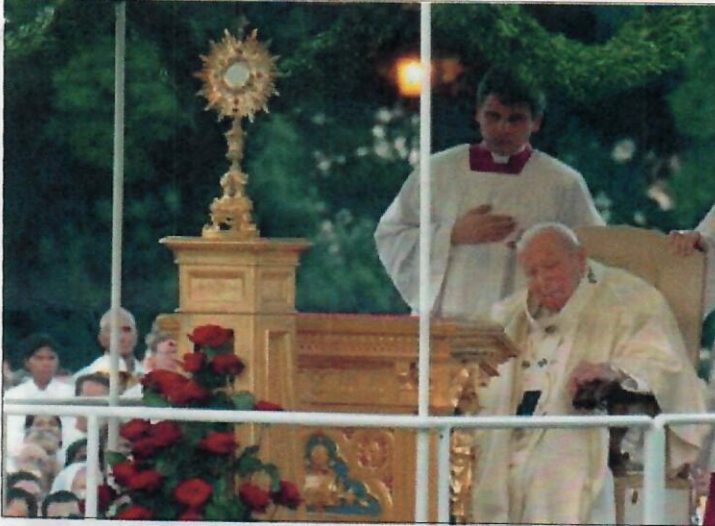
Sacramentsdag, donderdag 10 Juni 2004

Van het Internet pikten wij het volgende bericht op: Vaticaanstad (RKnieuws.net) - Paus Joannes Paulus II roept een Jaar van de Eucharistie uit. Het start bij het begin van het Internationaal Eucharistisch Congres, dat van 10 tot 17 oktober in de Mexicaanse bedevaartsplaats Guadalajara plaatsheeft en eindigt met de bisschoppen- synode, van 2 tot 29 oktober 2005 in Rome. Die synode staat in het teken van de eucharistie.