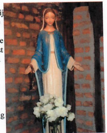
O.L. Vrouw v.d. Berg Karmel