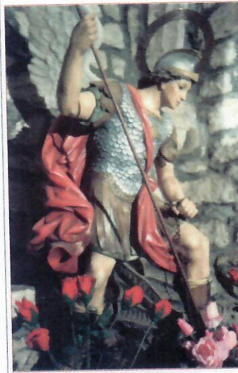
Het Michaelbeeld in het kerkje van Garabandal

We hebben hier goede basisgegevens en een fundamenteel getuigenis en dat zou voldoende moeten zijn. Doch er zijn eveneens sommige ondersteunende getuigenissen, die ik hier zal memoreren.