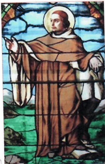
De H. Bernardus schreef...

De H. Bernardus schreef dat er een tijd zou komen dat de Kerk