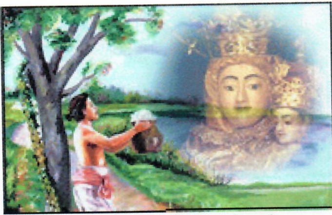
Een ongelooflijk schone Dame, die een en al genade uitstraalde.

Het was op een morgen dat de herdersjongen bij het krieken van de dag, met melk onderweg was. Ondanks de zware arbeid nam hij zijn taak serieus en deed zijn werk zoals dat van hem verlangd werd. Toen hij een vijver aan de Anna Pillai straat passeerde, werd hij overvallend door vermoeidheid. Nabij een boom overviel een ongewone slaap hem. Op dat moment kreeg hij een visioen. Een ongelooflijk schone dame, die een en al genade uitstraalde, met een al even mooi kind verschenen aan hem. Ze hadden zgn halo's rond hun hoofd. De moeder vroeg de herdersjongen om wat melk voor haar kind dat de jongen aan de moeder gaf. Toen het visioen voorbij was spoedde de jongen zich naar zijn meester en vertelde deze over het voorval.