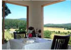
Natuurschoon rond Toolangi.

Opeens ging de telefoon in mijn slaapkamer. Ik schrok, en dacht, “dat is nariigheid!”. Want normaal gaat de telefoon nooit zo vroeg over. Ik sprong uit bed en nam de telefoon op.