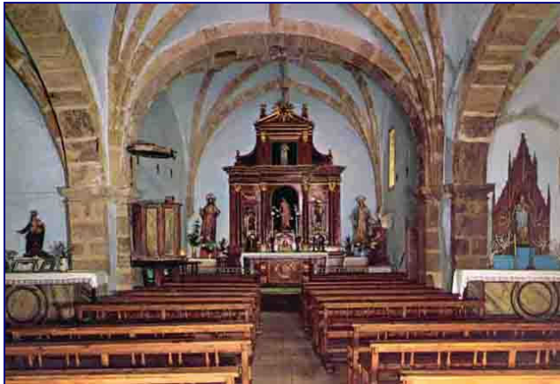
Het kerkje van Garabandal