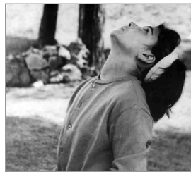
Conchita ontvangt de H. Communie

De daarop volgende jaren zouden vele priesters en katholieken hun geloof daarin verliezen. In de 2e Boodschap van Garabandal van 18 juni 1965 leest men dan ook dat men steeds minder waarde aan de Eucharistie ging hechten.