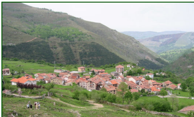
Garabandal mei 2008

waren de antwoorden in volledige overeenstemming met de Katholieke leer. (Dit is natuurlijk een basis toetssteen voor echtheid.) De kinderen gingen dikwijls te rade bij Maria of de engel, voordat zij antwoord gaven, welke schenen te bevestigen dat ze door hun sublieme eenvoud van hemelse bronnen kwamen. Wat God heeft verborgen voor geleerden en wijzen, heeft Hij geopenbaard aan de onschuldige kinderen. Andere vragen werden door de kinderen zelf opgesteld, om spontaan verklaringen te zoeken of onderwerpen van geloof.