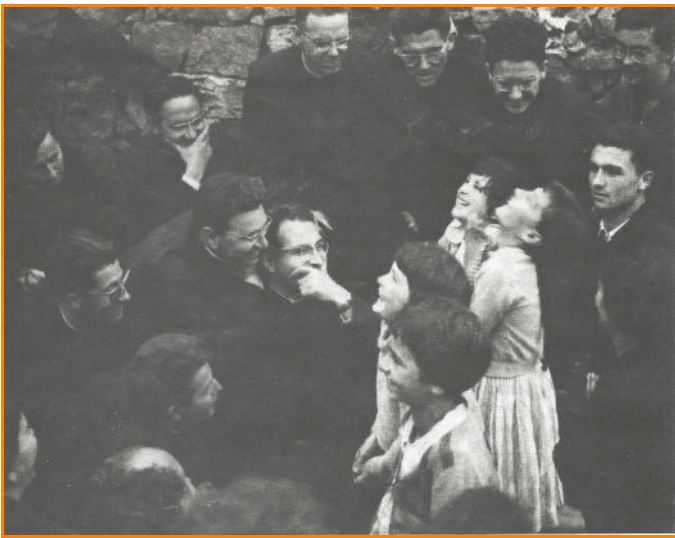
Priesters die dichtbij bij de zienersjes staan kunnen hun lach niet bedwingen, terwijl de meisjes opgaan in hun bekoorlijke samenspraak met hun visioen. Onze Lieve Vrouw toonde een voorliefde voor priesters en maakte de jonge zienersjes de grote waardigheid van de priesters duidelijk

Toen de eerste boodschap (18 oktober 1961) benadrukte om het Heilig Sacrament vaak te bezoeken, vertolkte de laatste boodschap (18 juni 1965) de diepe droefheid van de Hemel dat er steeds minder en minder belang werd gehecht aan de Eucharistie. Deze waarschuwing kwam in een tijd dat het Eucharistisch geloof met de consequente verwaarlozing, ontkenning, verachting, misbruik en heiligschennis nauwelijks was begonnen. Door de eeuwen heen had de kerk gezorgd voor een beschermend hek om haar meest kostbare geschenk, de Eucharistie, inaestimabile donum , de Gift zonder prijs. Nu, in de laatste chaotische jaren, werd dit hek stuk bij stuk ontmanteld en werden de Heilige vormen onderworpen aan de wispelturigheden en zwakten van iedereen. De leer van dit Mysterie van Geloof is bijna totaal weggevaagd in onze generatie. De praktische resultaten zijn: weinig bezoeken, weinig tekenen van eerbied, alleen gelaten zonder aanbidding, nu meestal behandeld als louter brood en wijn, machteloze symbolen meer dan gewone thema's dan als heilige werkelijkheden.