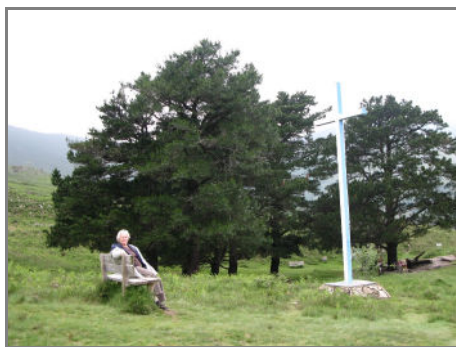
De pijnbomen in Garabandal. Een vreedevolle plaats waarvan, hopenlijk, vrede zich over de wereld zal verspreiden