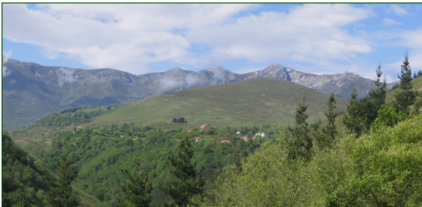
Plaats waar het Grote Wonder zal plaatsvinden