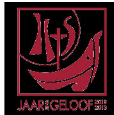
Uitleg van het logo:

Het logo bestaat uit een vierkant begrensd veld waarop een boot is te zien, die de Kerk symboliseert en die gepresenteerd wordt zeilend op een kleine golfslag. De hoofdmast van de boot is een kruis, waaraan zeilen zijn bevestigd in de vorm van het trigram IHS. (Een woord dat bestaat uit 3 letters). De achtergrond van de zeilen wordt gevormd door een zon die, in verbinding met het trigram, ook verwijst naar de Eucharistie.