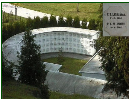
Zijn laatste rustplaats in Loyola