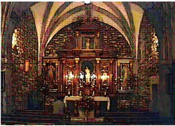
Het interieur van het kerkje van Garabandal.

zo leidt haar Zoon ons tot de Vader. (Joh.14.6)