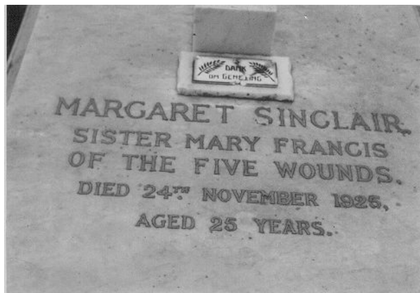
Let op het steentje met opschrift: "Dank om genezing"