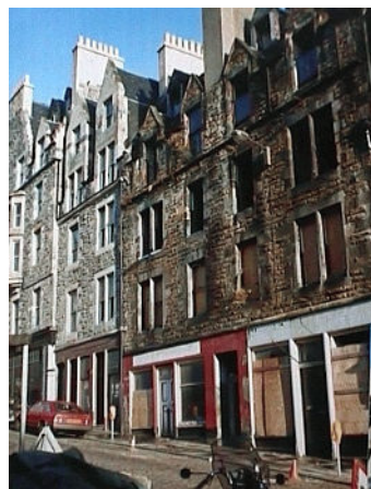
Enige jaren geleden