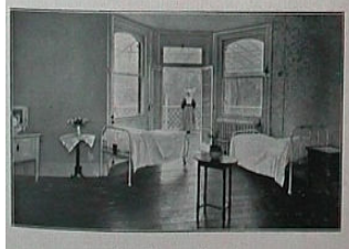
Het sanatorium in Warley.

volle bewust was van haar ziekte, straalde ze temidden van haar lijden zulk een blijvende vreugde en sereniteit uit, dat de verpleegsters er verbaasd over stonden. "Men kon nooit te weten komen wat ze graag of niet graag had", merkte een verpleegster vol bewondering op.