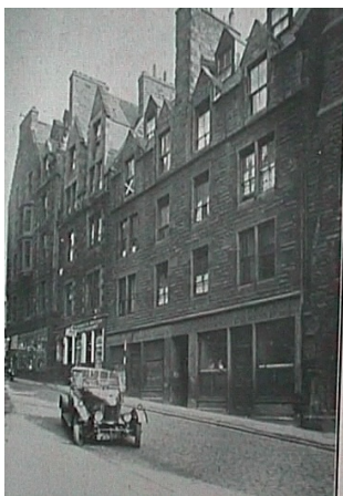
Blackfriarsstreet rond 1930.