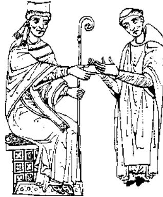
Deze illustratie van een manuscript toont Gregorius VII met de abt van de H. Sophia, Gregorius, een groot hervormer, beval Berengarius om de leer van de Kerk over het H. Sacrament te aanvaarden

De woorden konden niet duidelijker zijn. Als werkelijkheid betekent actualiteit en als actualiteit betekent objectiviteit, dan gelooft het Katholieke geloof dat de Christus die in de Eucharistie is, de historische Christus is, degene die werd ontvangen in Nazareth, geboren in Bethlehem, gestorven en verzezen is uit de doden in Jeruzalem, en nu gezeten is aan de rechterhand van God, de Almachtige Vader. Het is de Christus, die ons zal roepen wanneer we uit de tijd stappen, de eeuwigheid in. Het is de Christus, die bij het einde van de wereld zal verschijnen om de levenden en de doden te oordelen. Het is de Christus, die de Omega van het heelal is en het doel van de menselijke bestemming.