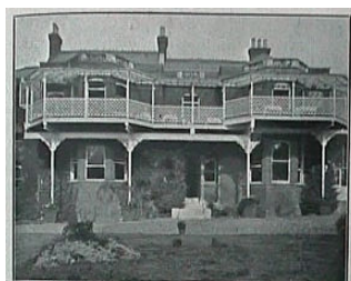
Het Marillac Sanatorium te Warley, Essex.