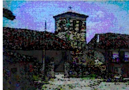
Het kerkje van Garabandal

Moeder Gods door het dorp. Bidden, zingend en pratend. Ze bezochten door de weken heen alle woningen, het groepje pijnbomen welke boven het gehucht tegen een berghelling staan, maar bovenal naar het kleine kerkje, toegewijd aan de