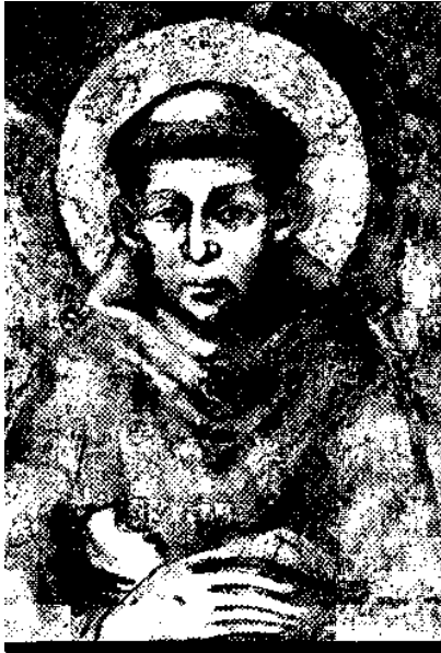
Ten aanzien van het H.Sacrament bepleitte St. Franciscus van Assisië een uitzondering op zijn weg van volledige armoede