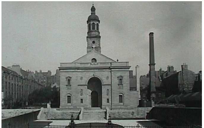
Haar parochiekerk in de jaren 30