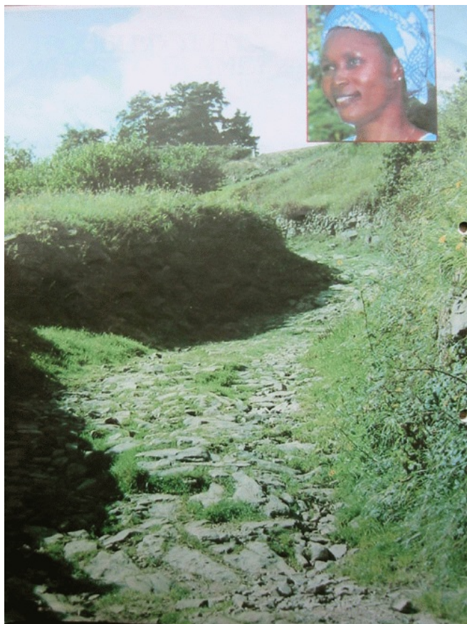
Het weggetje naar de pijnbomen, het callega genaamd..