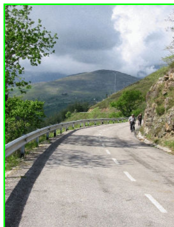
De nieuwe weg van Cosio naar Garabandal