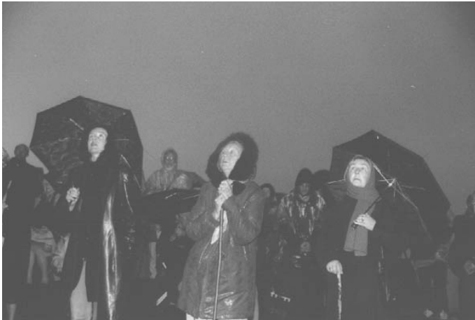
Donderdagavond 11 April. Pelgrims in gebed bij de pijnbomen.