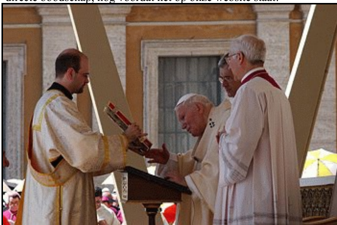
De heiligverklaring van pater Pio op 16 Juni 2002

Moedig a.u.b. uw familie, vrienden en allen aan, die Onze Gezegende Vrouwe vereren, hun e-mail adres te laten registreren bij onze website Garabandal.us -als zij snel nieuws willen ontvangen m.b.t. de Waarschuwing en de Acht-Dagen-Aankondiging-door mijn directe boodschap, nog voordat het op onze website staat!