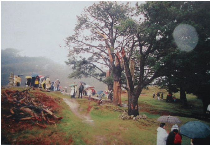
Bij de pijnbomen. Wachten op het Wonder dat niet kwam