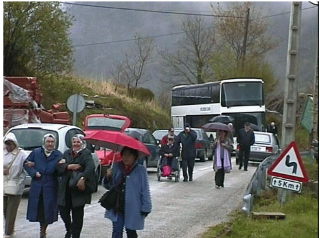
Aankomst te Garabandal vergezeld van regen en kou.

Bij de telefoon-fax apparaat is een luidspreker aangesloten zodat men haar stem kan opnemen